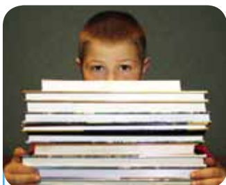
Uit de regio's