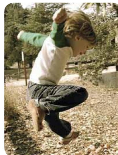
Foto4Nature: kiek je favoriete speelplekje