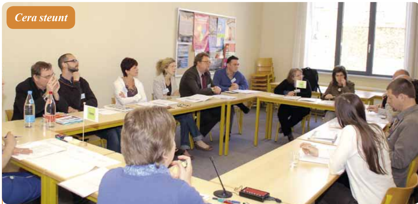
Tijdens de rondetafel werden knelpunten geformuleerd en oplossingen voorgesteld.