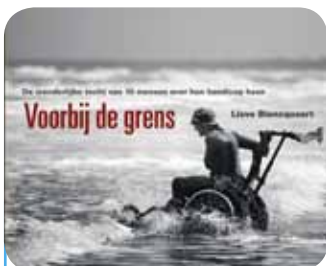
Cera voor jou