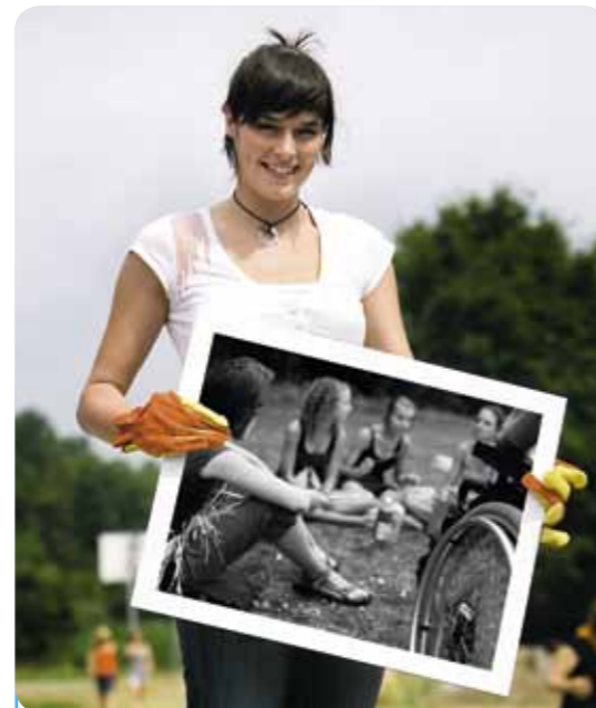
Cera daagt alle Belgische jeugdbewegingen uit...