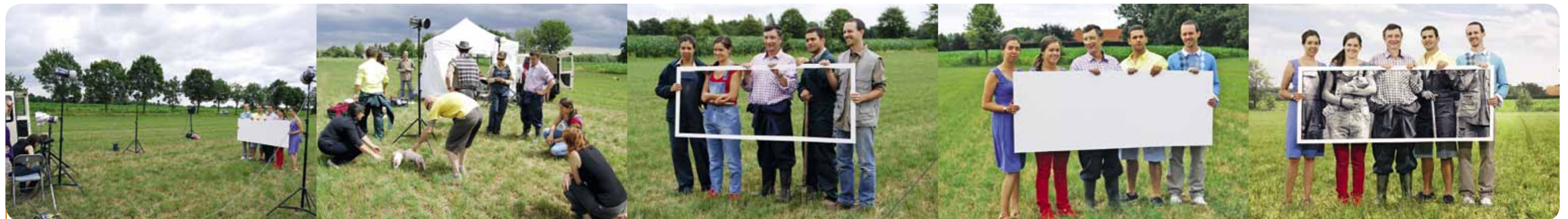
Hoe de campagnefoto voor het Boerenburenplan tot stand kwam...