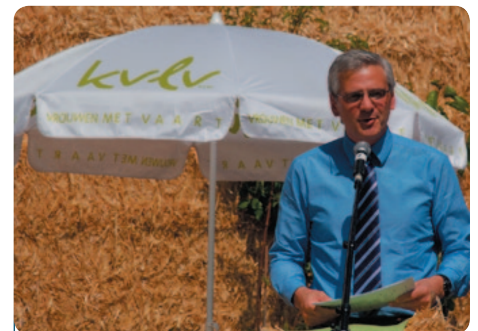
Ministerpräsident Kris Peeters gab den Startschuss für 'Weibliches Talent auf dem Lande'.