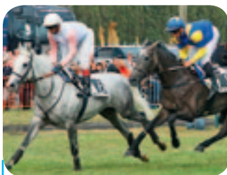
Für einen Spottpreis nach Waregem Koerse