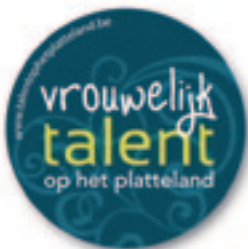
Weibliches Talent auf dem Lande