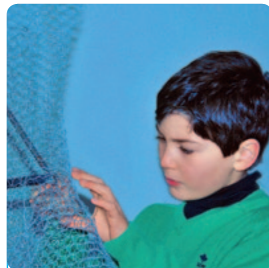
Das Projekt „De Kim-Sam“ gewann das Foto „Kunstige handen“ den Hauptpreis unseres zweiten Fotowettbewerbs.