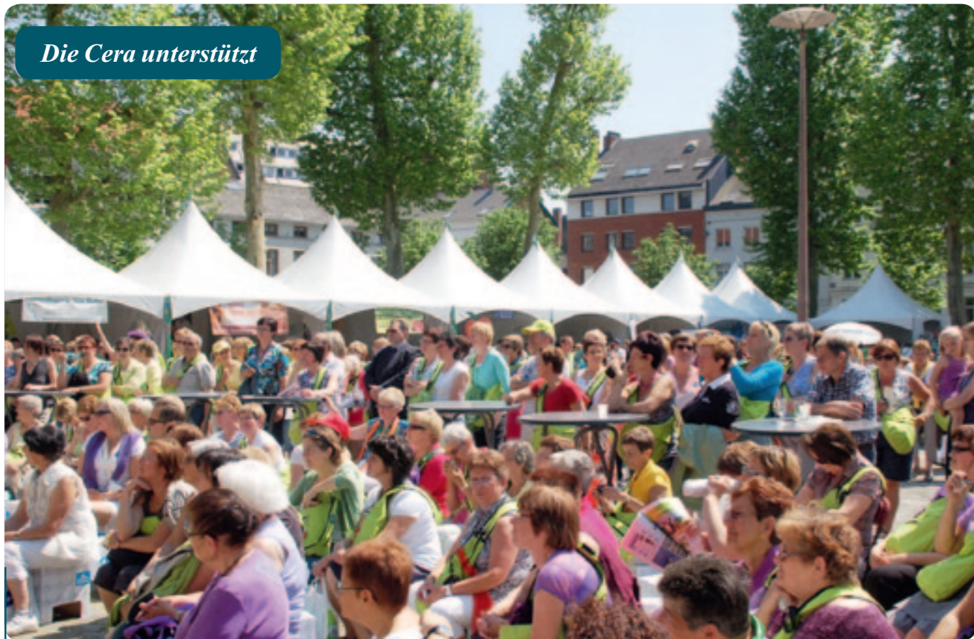
Am 21. Mai feierten Tausende KVLV-Frauen das hundertjährige Bestehen ihrer Organisation mit einem großen KVLV-Event.