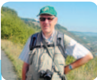
Die Freiwilligen des Jahres Seite 8