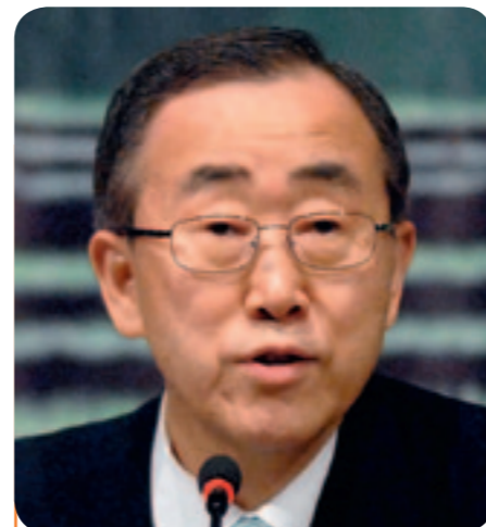
Ban Ki-moon, Generalsekretär der Vereinten Nationen

Neue Dynamik Ban Ki-moon, Generalsekretär der Vereinten Nationen, drückt es so aus: "Genossenschaften erinnern die inter-