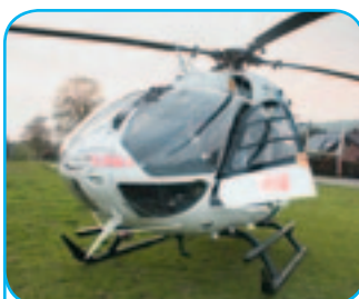
Regionale Projekte Seite 6