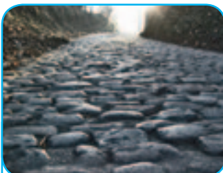
In der ersten Reihe bei der "Tour de Flandres 2012"? Seite 7