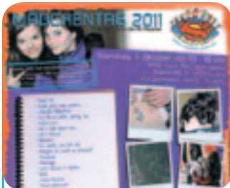
Mädchentag in Kelmis! Seite 3