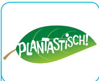
Beleef een Plantastische dag!