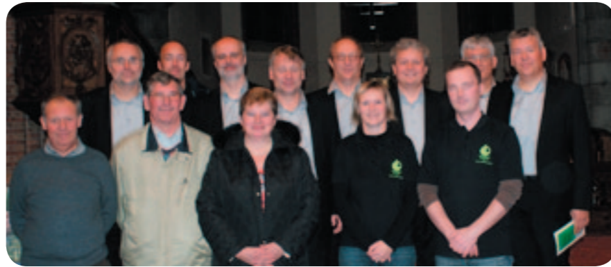
Gezinsbond Snaaskerke met Septem Viri.

CAW 't Verschil vzw, Kuringersteenweg 439 bus 3 in 3511 Hasselt. Tel. 011 85 92 40, centraledienst@cawtverschil.be - www.cawtverschil.be.