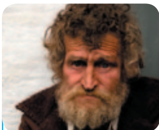
Uit de regio's