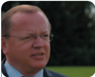
Een man met een missie