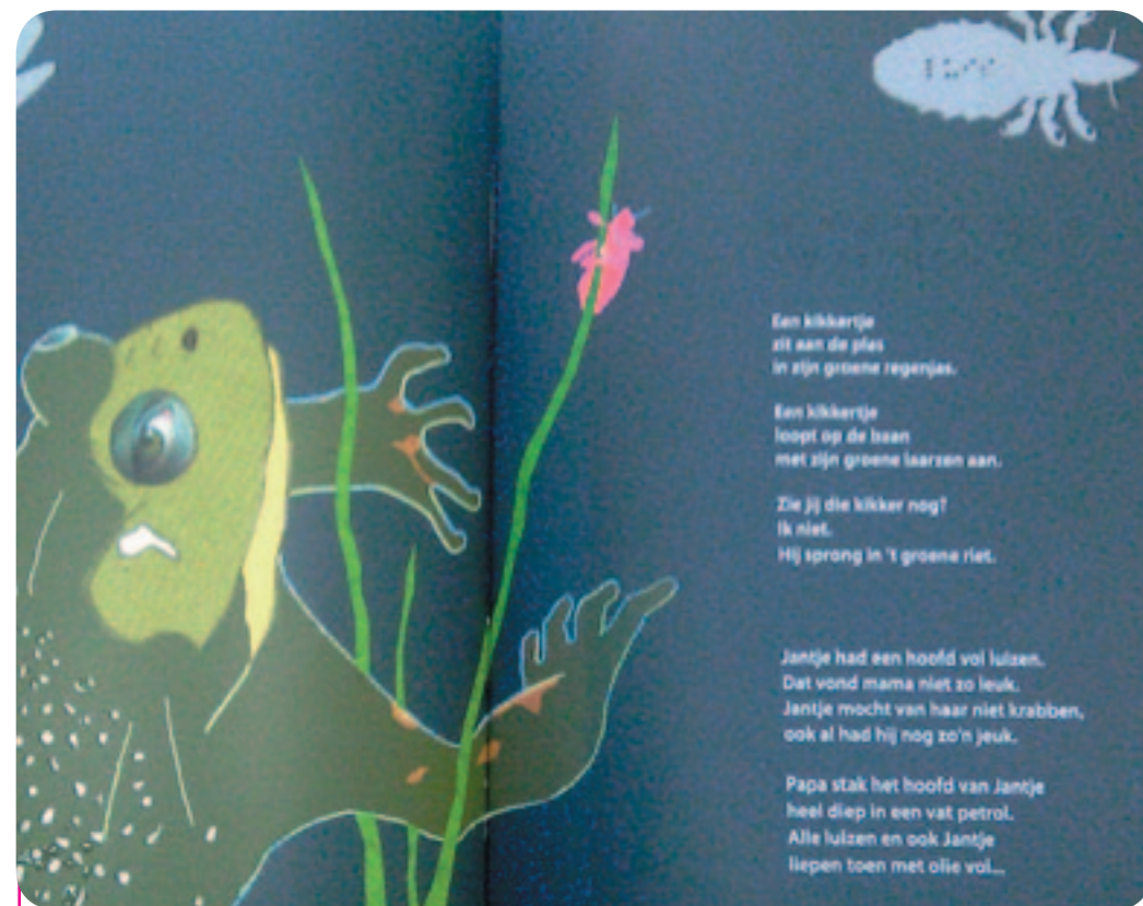
Het boek spreekt meer zintuigen aan dan alleen de ogen.

zijn weg in het gewone boekencircuit en naar de boekenbeurs. Daarnaast onderhandelen we met de openbare bibliotheken en met de steun van de Vlaamse Gemeenschap proberen we