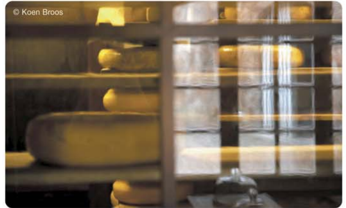
▲ Vandaag zien we een heropleving van het coöperatief ondernemen.